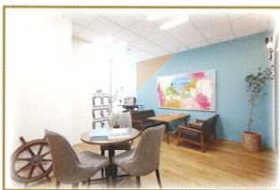
打ち合わせルーム

シーセレモニーでは、ご遺族の皆様でもお越しいただけるよう、豊富なサイズのお打合せスペースをご用意しております。