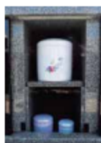
※水に浸かる心配のないカゴです。