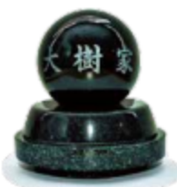
埋葬部分の上部に玉石碑を設置することが可能です。石の種類はお選びいただけます。玉石碑は永代使用料に含まれております。